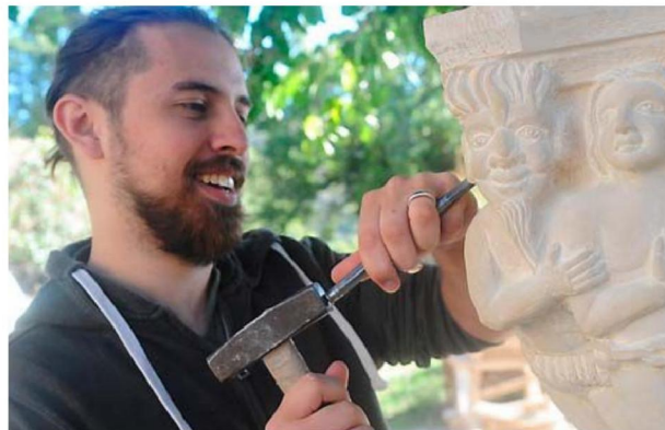
La réplique sera exposée à l'abbaye d'Aniane dans le cadre de l'aménagement prévu en 2022.